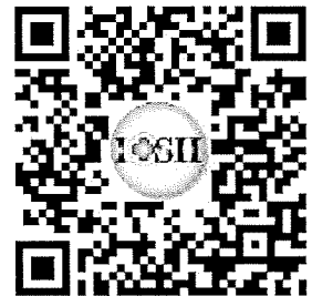
活動報名 QR code