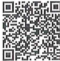
查詢是否報名成功